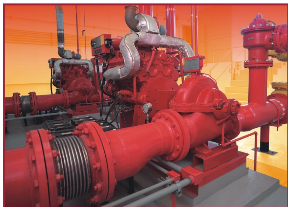
Conjunto Motobomba diesel aprovado FM

Somada à tecnologia e à segurança dos sistemas, existe outra grande vantagem para empresas ou indústrias. Quanto mais confiável for seu equipamento, menor serão os gastos com seguros. Com essa garantia, seus recursos podem ser aplicados no maior investimento que um empresário pode fazer: seu patrimônio e vidas.