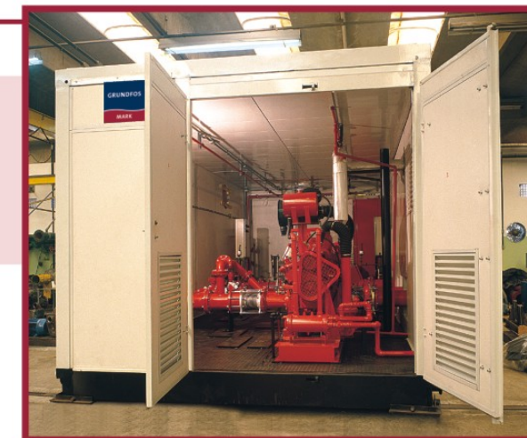
Sistema montado em Container

A Mark Grundfos desenvolve o mais avançado e versátil sistema de bombeamento contra incêndio. São conjuntos completos, com soluções integrais e equipamentos dimensionados para garantir máxima confiança. São montados em Skid e fornecidos opcionalmente em Container. Cada projeto inclui a motobomba com motor diesel e/ou motor elétrico, motobomba jockey, painéis de controle, registro de sucção e de recalque, válvula de alívio, medidor de vazão, linhas sensoras, tanque de combustível, interligações elétricas, tubulações e demais acessórios.